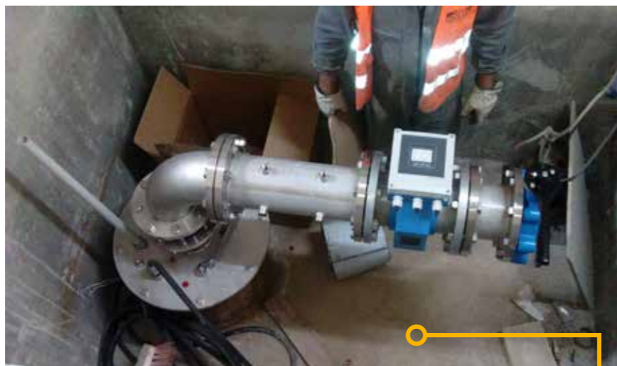
Il pozzo finito

con tutte le complicazioni logistiche dovute alla dimensione della pompa, al condizionamento del fango, la separazione dei detriti di perforazione e il loro smaltimento. La proposta tecnologica alternativa sottoposta alla committenza da IDROGEO era quella di realizzare i pozzi, visti i grandi diametri richiesti, mediante la circolazione inversa con pompa di aspirazione utilizzando come fluido solo acqua additivata da un polimero a base vinilica. Per soddisfare questa alternativa tecnologica e per rientrare nelle condizioni di spazio estremamente ristrette del cantiere, l'impresa IDROGEO, in collaborazione con l'ufficio progettazione Comacchio, ha individuato nella perforatrice MC 5 D la più adatta allo scopo. La perforatrice, installata su carro cingolato a carreggiata variabile, è stata fornita con centralina elettrica separata da 75 kW, anch'essa installata su cingolo. L'utilizzo di un mast ad altezza ridotta ha permesso di rispettare la quota massima di 2,2 m di luce interna. La testa di perforazione idraulica da 1300 daNm con